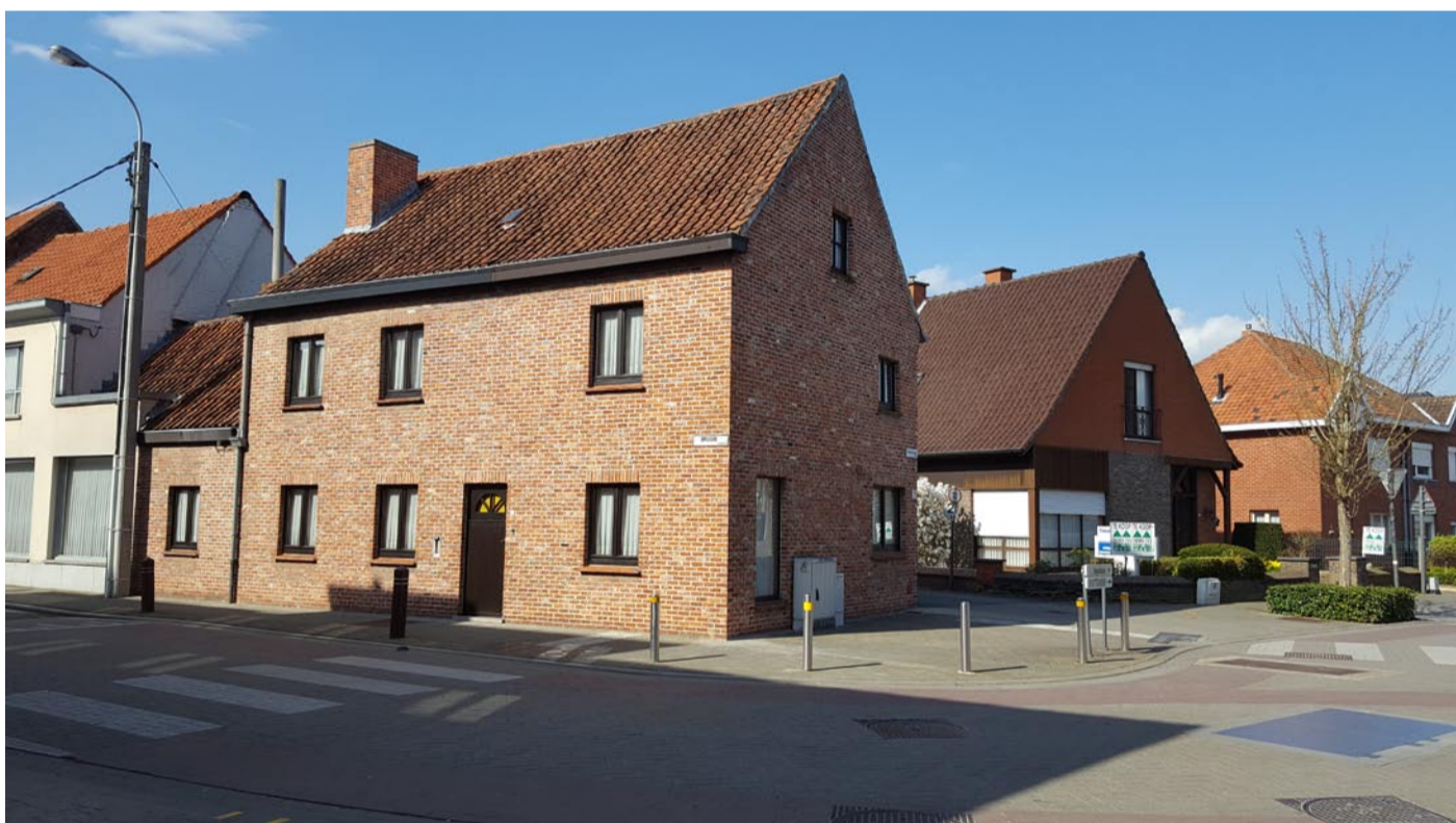
De situatie in 2017