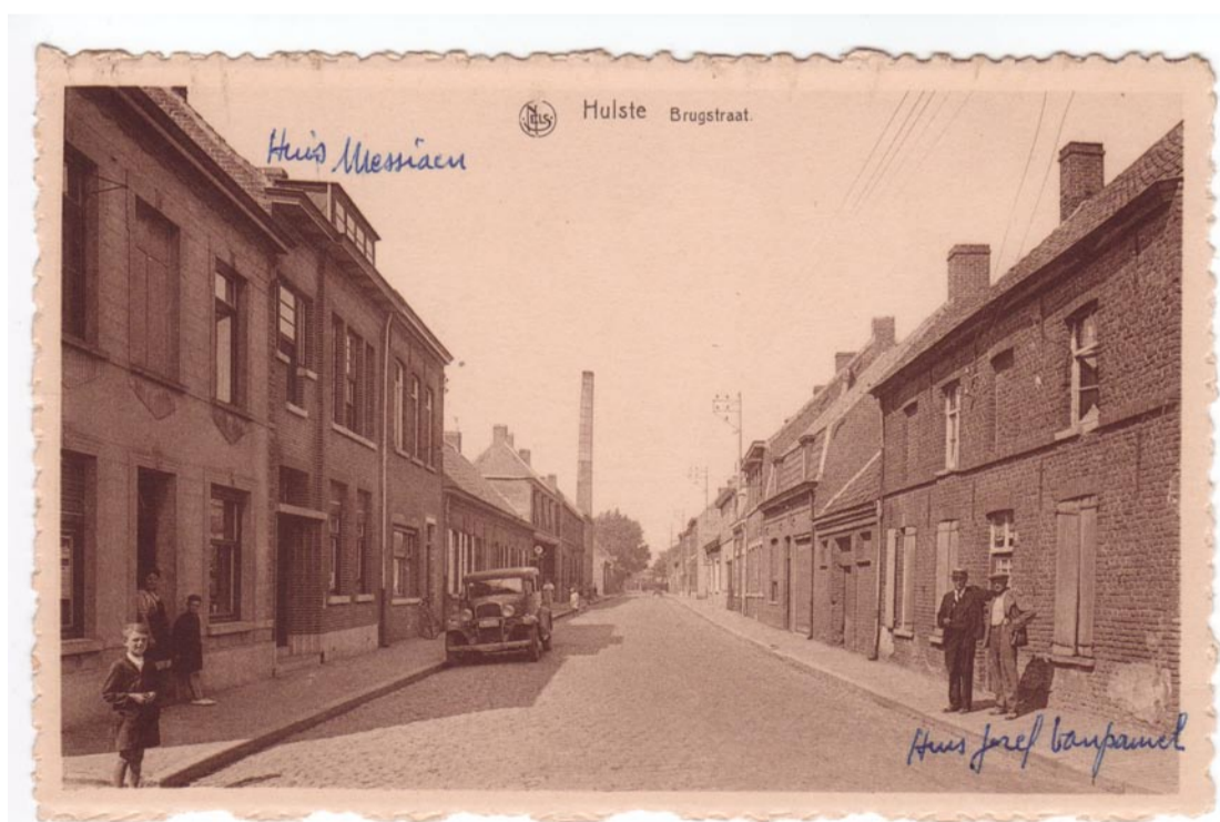
De Fonograaf - later Het Boldershof: het eerste huis rechts. Daarnaast, verderop, ooit café De Snisse. Aan de linkerkant, het eerste huis: vroeger slagerij Vanassche, nu De Vleeshoek en daarnaast was er ooit de herberg Van Paemele.